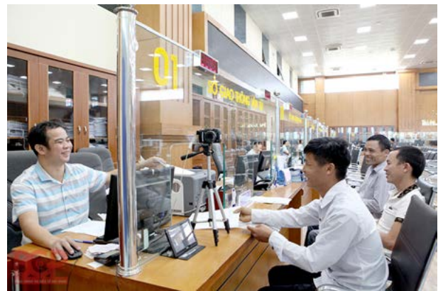
Triển khai thực hiện nghiêm túc, hiệu quả việc tiếp nhận, giải quyết thủ tục hành chính theo cơ chế một cửa, một cửa liên thông bảo đảm đúng yêu cầu quy định và lộ trình thực hiện

quyết của cơ quan trung ương được tổ chức theo ngành dọc đóng tại địa phương đưa ra tiếp nhận tại Trung tâm Phục vụ hành chính công cấp tỉnh, Bộ phận Tiếp nhận và Trả kết quả giải quyết thủ tục hành chính cấp huyện, cấp xã trong Công an nhân dân, Thủ tướng Chính phủ có ý kiến chỉ đạo như sau: